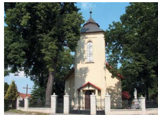
Kościół Św. Wawrzyńca w Goszczy

W XV wieku istniał w Goszczy wspomniany już, stary wielki gaj dobrze zalesiony wielkości 2 mil, 3