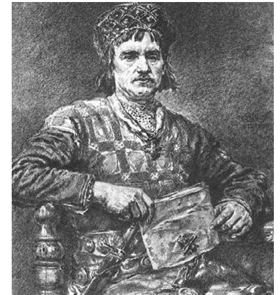
Książę Bolesław V Wstydliwy

Początki Goszczy oraz wiele wieków jej historii związane są ściśle z Kościołem pod względem religijnym, kulturowym, własnościowym, ekonomicznym. Ludowa legenda wiąże bowiem początki miejscowości z osobą Świętego Wojciecha, który miał tu odpoczywać na zboczu wzgórza, z którego wy-