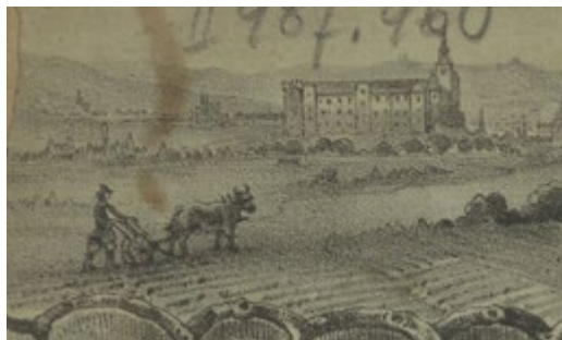
Włościanin z okolic Mogiły na tle klasztoru (fragment okładki pracy N. Ekielskiego pt. Okolica Mogiły, Kraków 1864, druk Czasu)